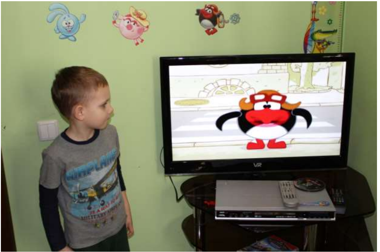
Рисование «Сигналы светофора»