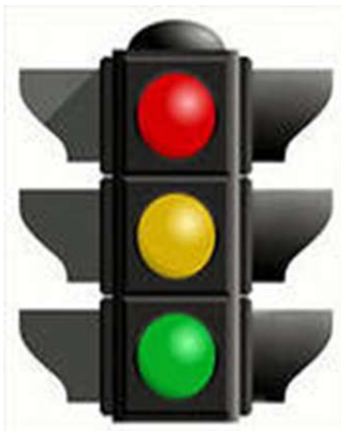
Светофор для автотранспорта