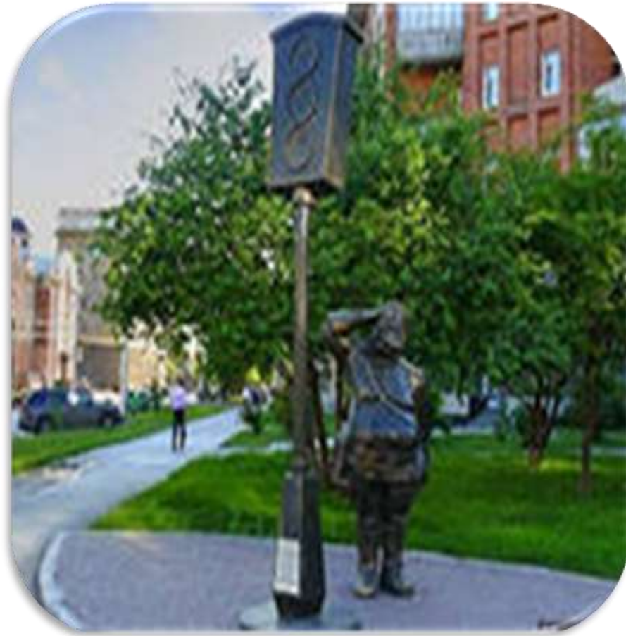
Первый памятник в Новосибирске