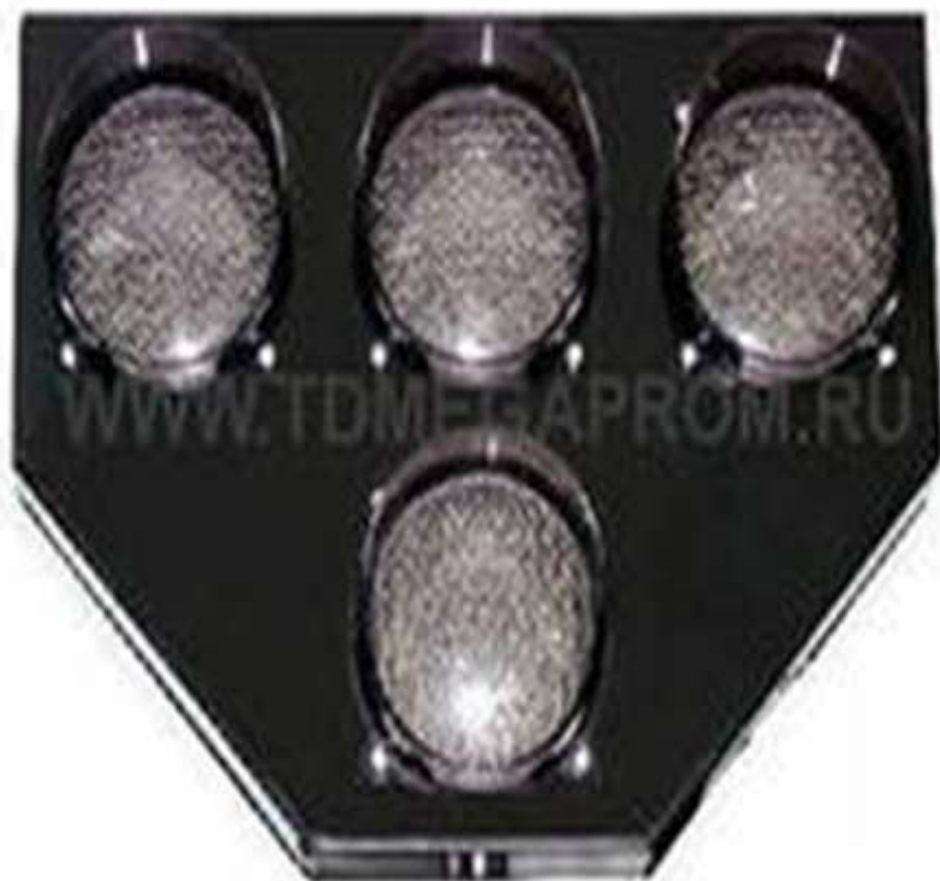
Светофор для трамваев