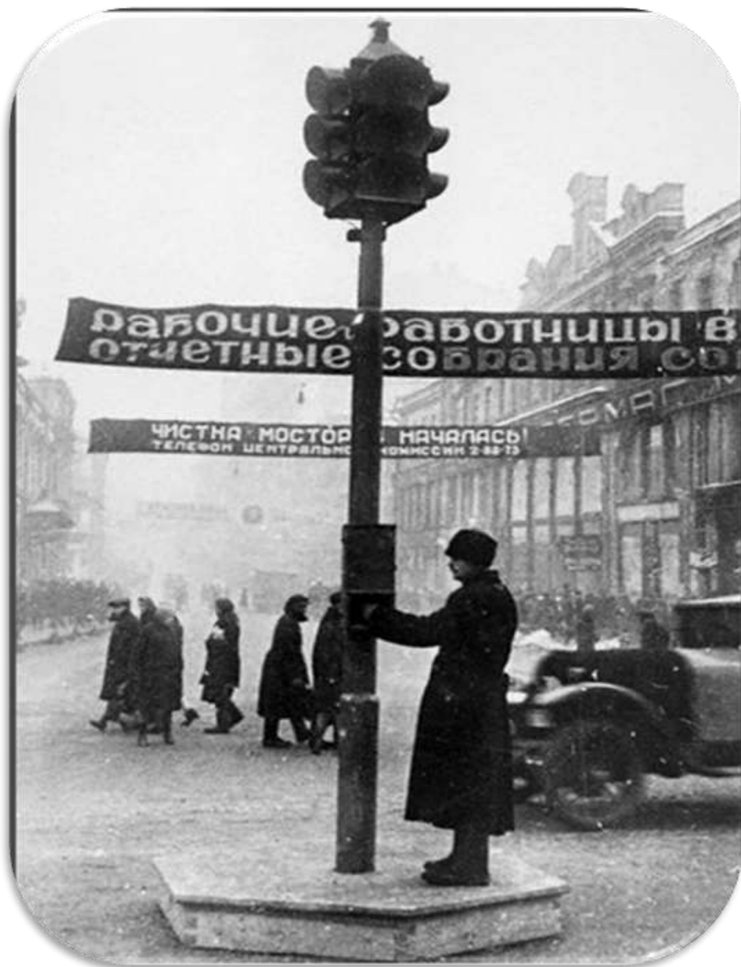
Первый светофор в Москве