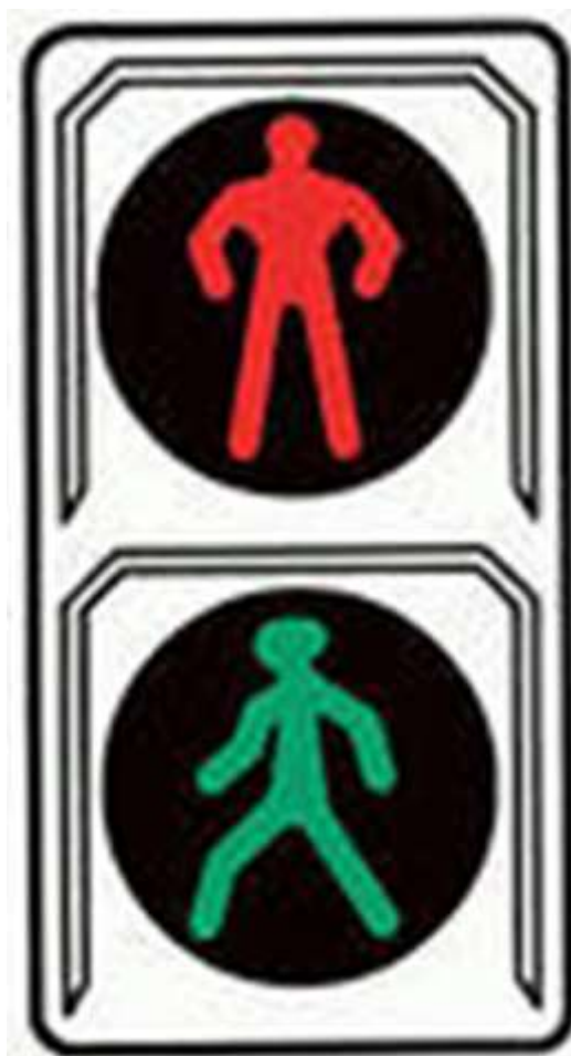
Светофор для пешеходов