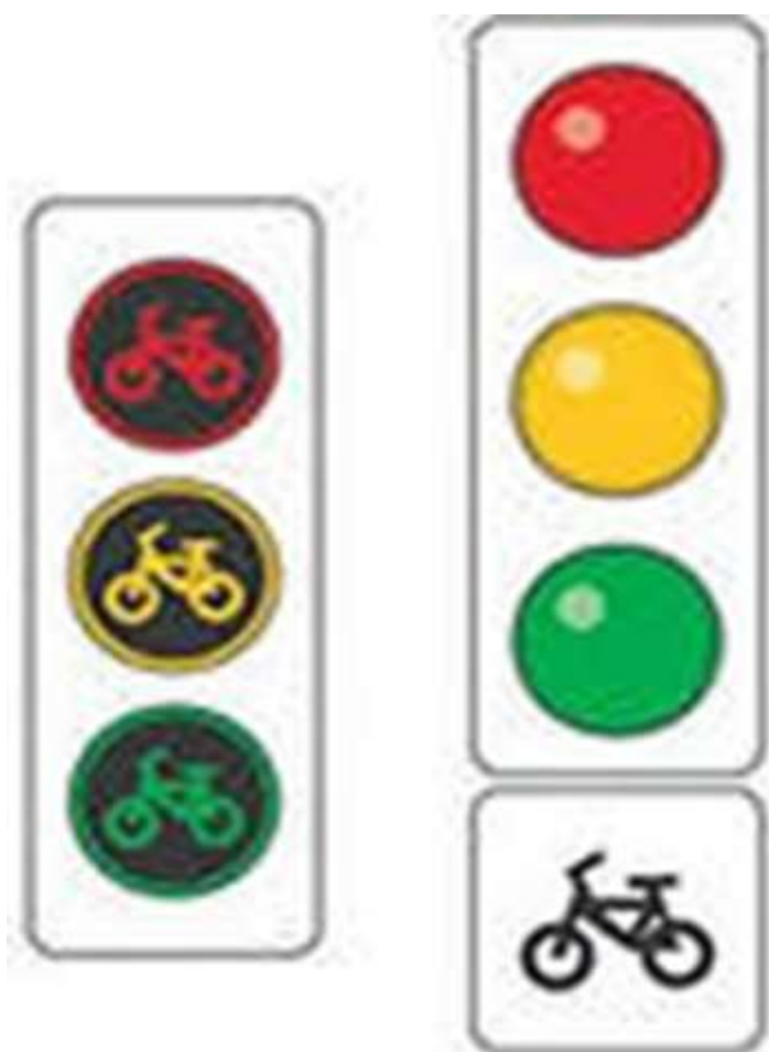
Светофор для велосипедистов